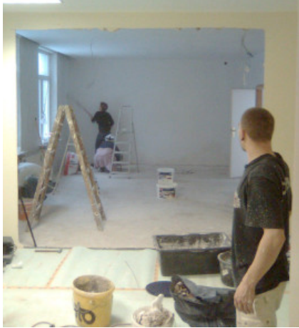
auf den restlichen Wänden aus.