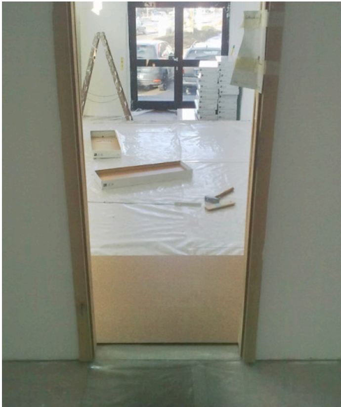
Blick vom großen Gruppenraum in den Eingangsbereich der auch mit Kork Kinder und Eltern empfängt.