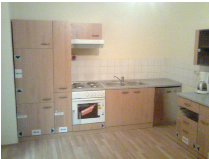
...bis sie steht!