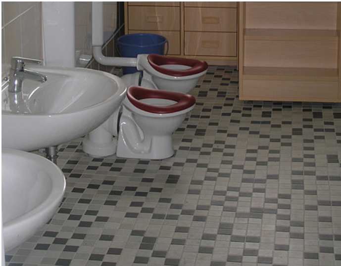
Unsere sanitären Einrichtungen und Wickelkommode wurden eingerichtet mit Fördermitteln und den Einsatz unserer Eltern.