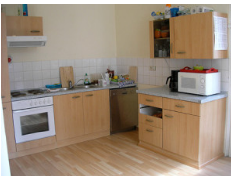
Unserer Küche endlich in Benutzung.