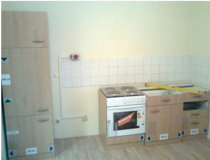
Die Küche entsteht...