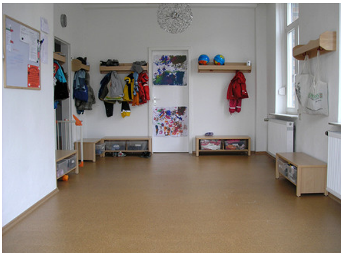
Endlich, am 31. Januar 2011 ist alles fertig! Die folgenden Bilder zeigen wie schön unsere Räume nach all der vielen intensiven Arbeit geworden sind...