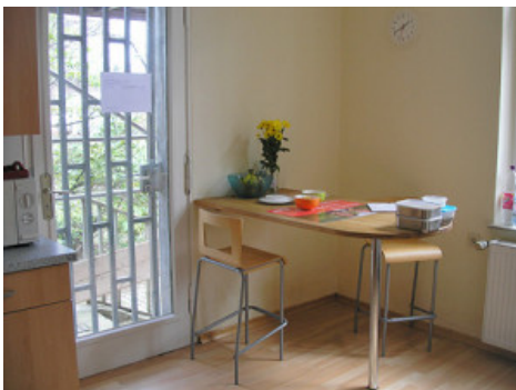
Die Küche liegt gleich neben dem Betreuungsraum.

Über sie gibt es auch einen Zugang zum Garten.