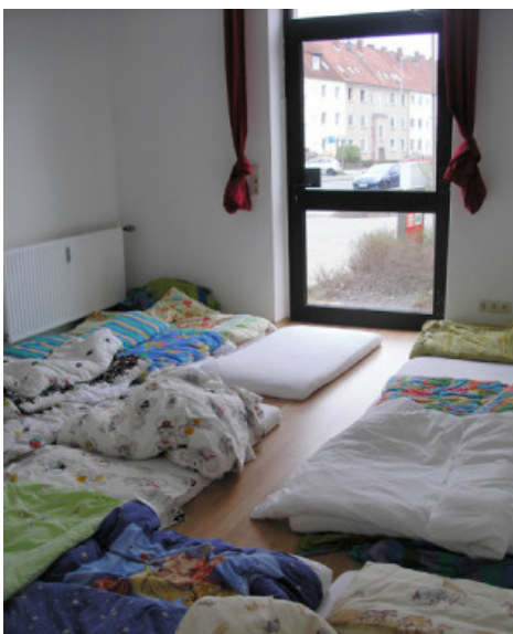
Unser Schlafrum mit 15 Matratzen.

Über sie gibt es auch einen Zugang zum Garten.